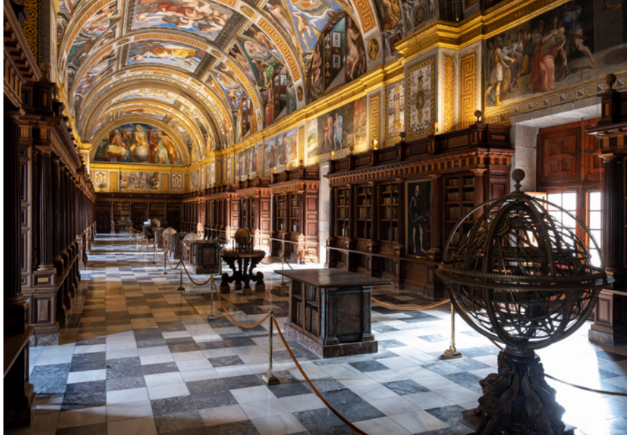
Biblioteca del Monasterio de San Lorenzo de El Escorial