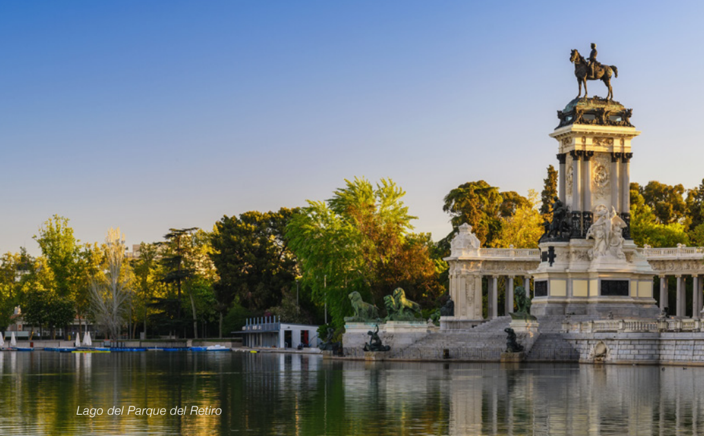
Lago del Parque del Retiro